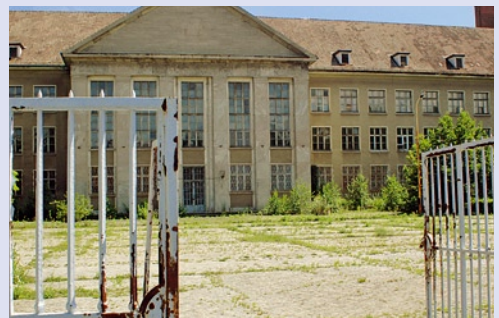
russischer Geheimdienst das Militärquartier. Im Juni 2008 verkaufte der Bund das Areal an einen Privatinvestor, der dort rund 200 Wohnungen plant.

Die streng bewachte Haupteinfahrt lag am Rondell Rheinsteinst-/Ehrenfelsstraße, eine zweite im Norden an der Waldowallee. Wer als einer der wenigen deutschen Angestellten in das Sperrgebiet durfte, benötigte einen „Propusk“. Diesen Ausweis gab es mit viel Geduld im zuständigen Büro Treskowallee / Ecke Hönower Straße, der ehemaligen Gaststätte „Künstler-Klause“. Sowjetische Dienststellen, für die auswärtiger Besuch unumgänglich